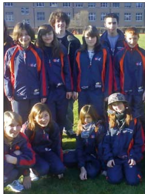
die grosse Jugi am Erdgas Cup, Seite 6